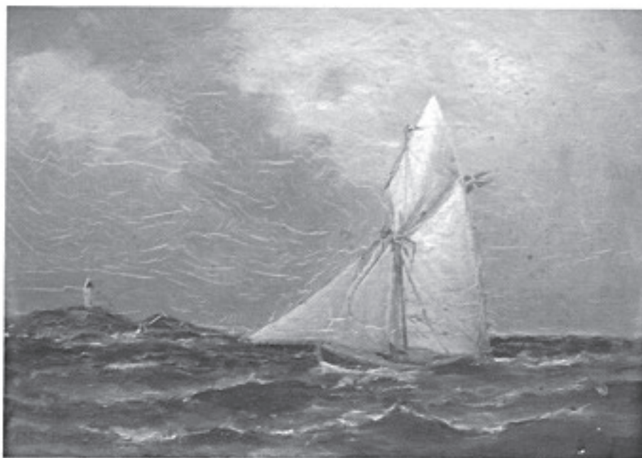
Sjöfröken som tulljakt. Målning i olja av Märten Oxenstierna.

Figur 5 Ur Frank Engelbrektssons bok. Bakre pärmen.