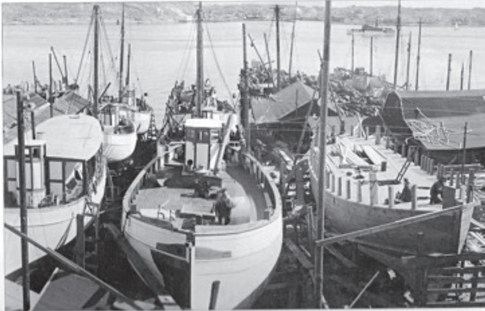
Vy över varvsområdet från sidan år under krigsåren på 1940-talet. Det var ständigt många fartyg inne för övervak och reparationer parallellt med att varvet under dessa år hade en omfattande nybyggnation av fiskebåtar.

Under äldre tid, när ön beboddes av fiskarbönder, låg centrum på Hälsö i stället i Gårn, där stora delar av jordbruksmarken fanns. De brukbara ägorna i Gårn fanns kvar långt in på 1900-talet och egentligen ända fram till förödelsen i samband med Buröledens byggande. Jordbruksmark i övrigt fanns bland annat i utägorna på Västeräng. Betesmarker för korna kunde man hitta utanför den egentliga ön på Burö, dit djuren fick ta sig simmande eller vadande. I Gårn ligger öns äldsta hus, sannolikt med anor från 1700-talet och här finns också många hus med ursprung i 1800-talet, givetvis mycket förändrade.