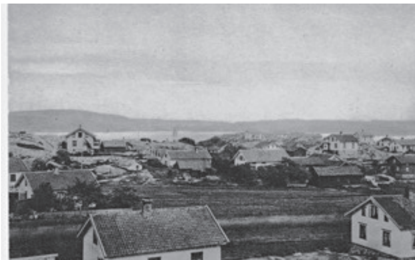
Gårn under 1900-talets första del.

Under 1900-talet hamnade öns centrum kring Gälekiln. Där byggdes en fiskehamn och nya livsmedelsbutiker och dit flyttades Strandkassan, som kom att flyttas en tredje gång innan den slutligen lades ner i samband med att fisket dog ut. Numera finns sedan lång tid inte en enda fiskebåt kvar. Den nybyggda konsumbutiken på Skuteskär ersattes av den fristående butiken Hälsö Livs, som också inrymde en indisk (och stundtals nepalesisk) restaurang. Ett kafé och en inredningsbutik tog över den gamla kokseboa och när fiskebåtarna var borta blev hamnområdet en enda stor hamn för fritidsbåtar.