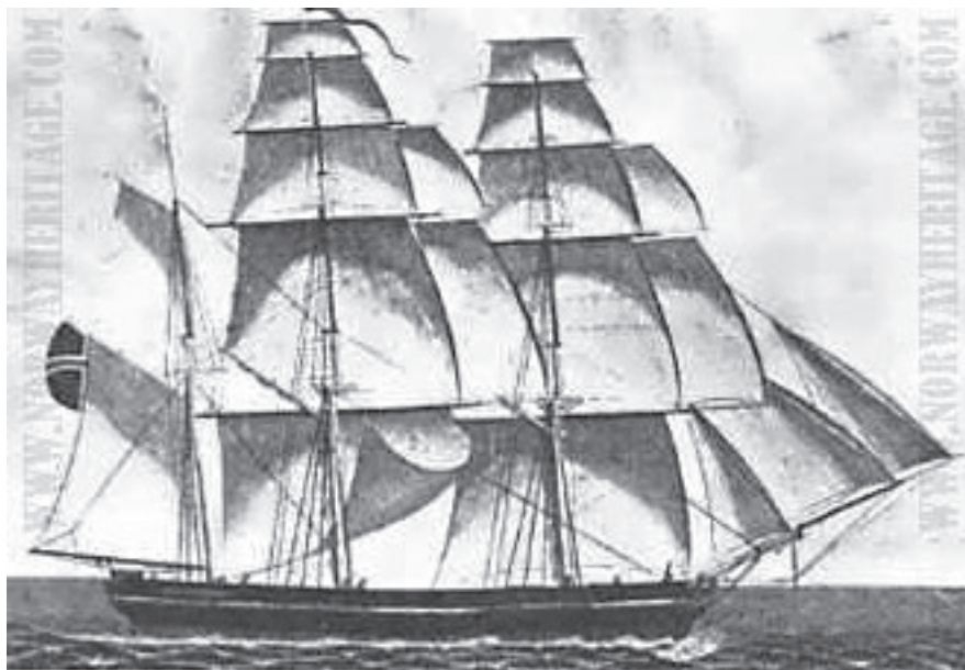
Figur 2 Bark, troligen av samma typ och storlek som Margareta

Det var sådana saker som gjorde att den blev det överlägset mest använda lastfartyget under andra halvan av 1800-talet. En bark hade ett displacement på 250-700 ton, så den här tillhörde de små.