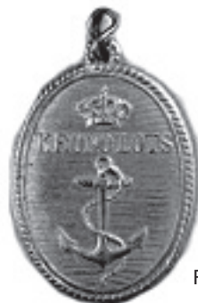
Figur 1 Lotsbricka