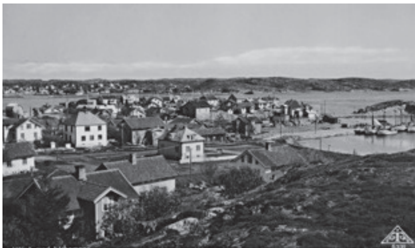
Gärn på 1940-talet.

Måndagen 12 september anordnar släktforskarföreningen en promenad kring det gamla Hälsö. Om föreningens tidning inte kommit ut före promenaden kan det kanske vara intressant att jämföra intrycken från rundvandringen med de bifogade bilderna från det dåtida Hälsö.