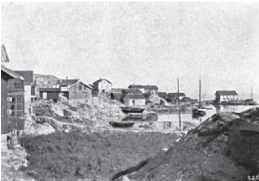
Hälsö, i Öckerö socken

Mitt bland Öckerö sockens tio bebodda öar ligger Hälsö. På många sätt har den lilla ön också legat i centrum för öarnas historia. Centrum på Hälsö - i varje fall från senare delen av 1800-talet - var området kring Qwia, bukten i öster. Där växte öns två båtvarv upp och dit lokaliserades tre livsmedelsbutiker och Strandkassan, fiskarnas andelsförening. Här låg också handelshuset Skäret, där skärgårdens hummerfiskare kunde lämna sina fångster. Qwia var dessutom den äldsta hamnen för fiskebåtarna, som förtöjdes vid dykdalber ute i bukten. Ett av Hälsös tre trankokerier låg i Qwia och de två andra i norr och söder från bukten räknat.