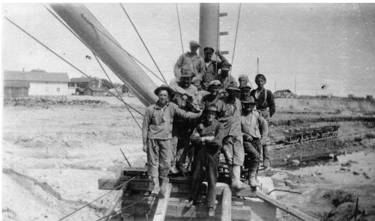
Från bygget av "mellanhamnen" i Klåva