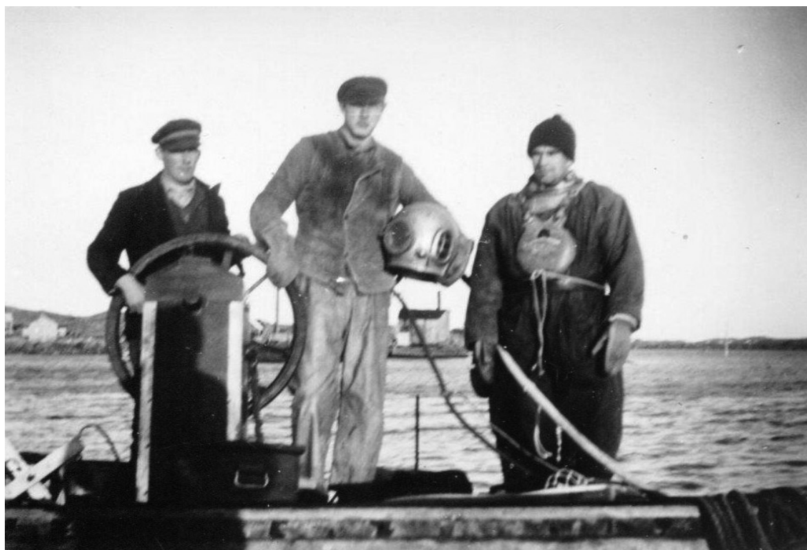
Dykare redo för ett dopp