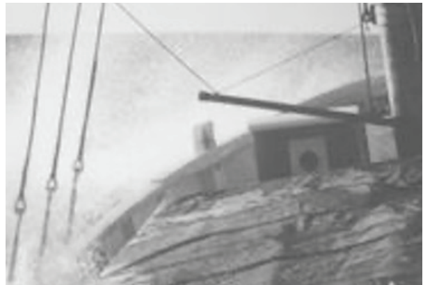
Hawila under gång