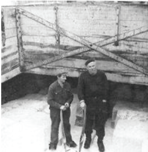
I Hawilas lastrum