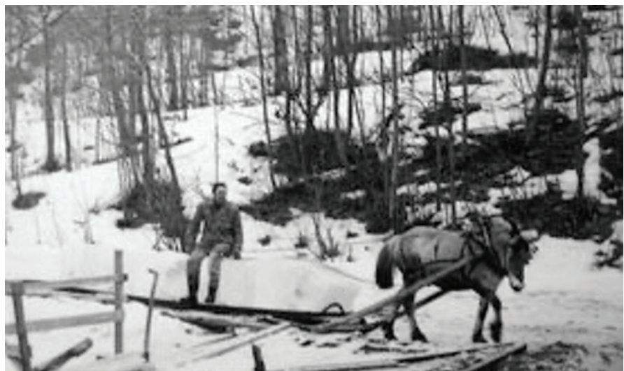
Här hämtas is för att lastas på Hawila